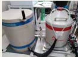
高純度ゲルマニウム半導体検出器

This system automatically scans and captures images of metaphases on sample slides in order to analyze chromosome aberrations. It is an essential system for efficient biological dosimetry.