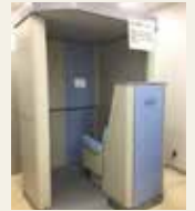
ホールボディカウンタ

The ICP-MS equipped with a plasma ion source and quadrupole mass filter can carry out multiple and trace elemental analyses. Long lived radionuclides such as 236 U, 129 I, 90 Sr can be applied by using the autosampler and desolvating nebulizer system.