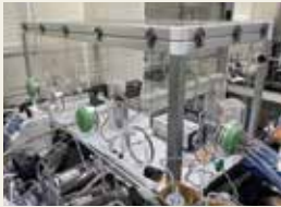
放射性ガス・エアロゾル用標準曝露システム

任意の放射性ガス・エアロゾル濃度の安定した環境を作り出すことができ、測定器の較正及び曝露実験を行うことができます。同様に微粒子を混合することで放射性微粒子の曝露も可能です。