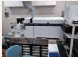
トリプル四重極ICP質量分析装置

The high purity germanium detector has high energy resolution gamma-rays, and the capability for identification and quantification of radionuclides. Thick and old iron and lead shielding enable sensitive analysis.