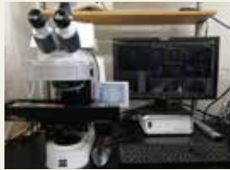
サイトジェネティック自動スキャンニングシステム

This exposure system can provide stable concentrations of radioactive gases and radioactive aerosols for calibration of associated monitors and other applications.